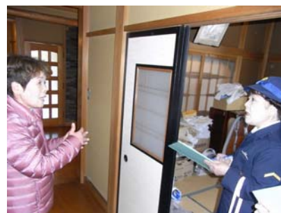
(参考) 昨年度の住宅防火調査の様様

※ 取材については、3月1日(金)午前中のみ対応とさせていただきます。取材していただける場合は、事前に上記担当までご連絡ください。