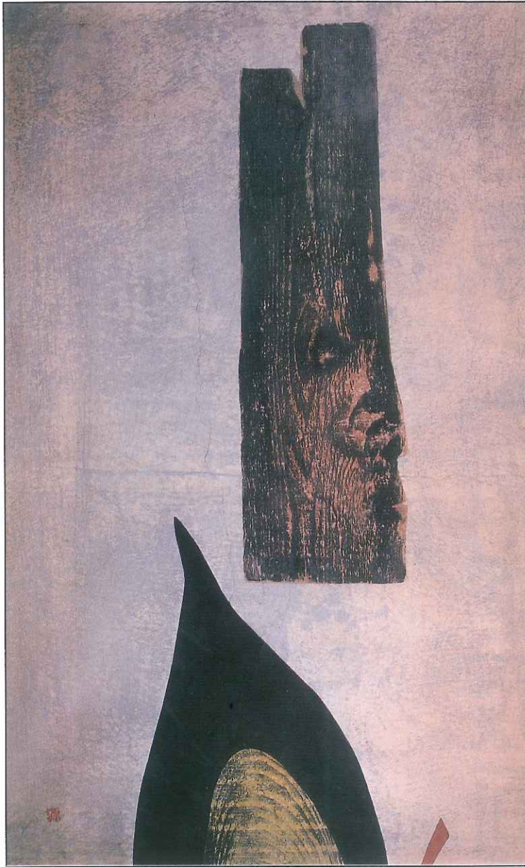
「能役者」A (モンミュゼ沼津蔵) 1958年ルガノ国際版画ビエンナーレ展 グランプリ