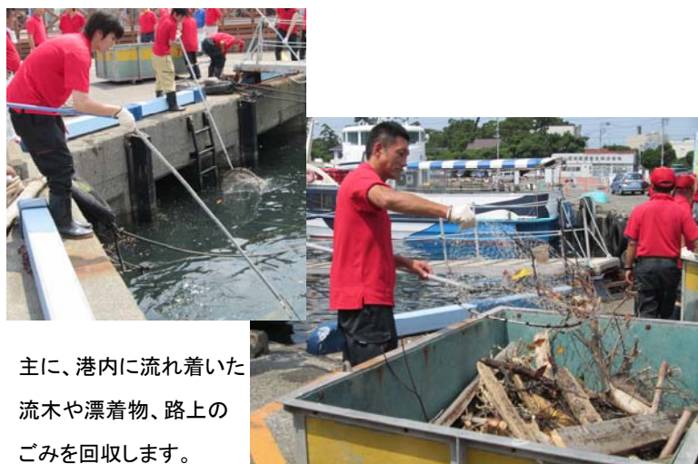
主に、港内に流れ着いた流木や漂着物、路上のごみを回収します。

参加者は、10 時に集合場所(沼津港内港船着場)で注意事項等の説明を受けた後、清掃活動を始めます。小雨決行です。