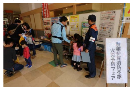
(参考) 昨年の火災予防フェアの様様