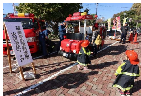
(参考) 昨年の火災予防フェアの様様