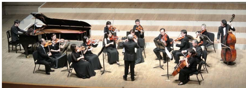
Hibiki Chamber Orchestra