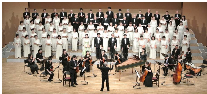
東駿河混声合唱団