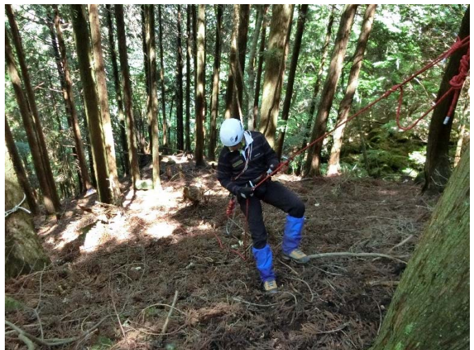
ロープを使用した降下訓練の様子