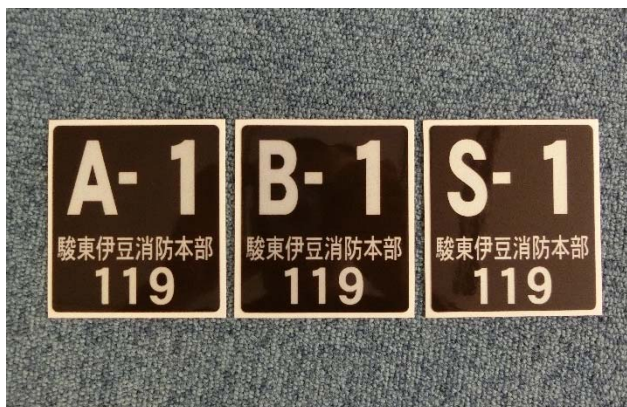
案内看板に貼付するステッカー