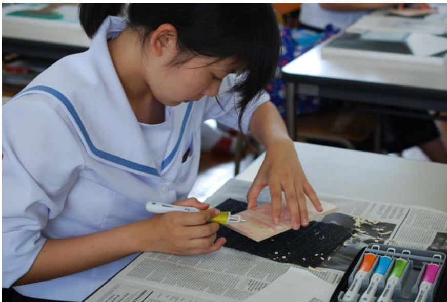
参考画像：版画（多色木版画）ワークショップ（6/21 実施、沼津西高等学校）