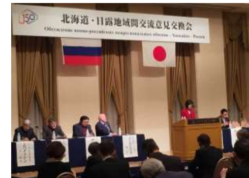
(本年1月の連邦院議員の北海道訪問:北海道庁HP)

2018年6月 「参議院自民党・日露議員懇話会」代表団(団長:世耕経産大臣)の訪露(サハ共和国)