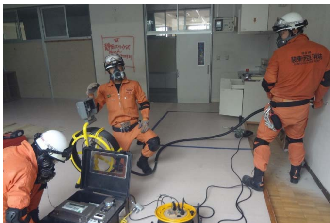
高度救助資器材の取扱い訓練の様子