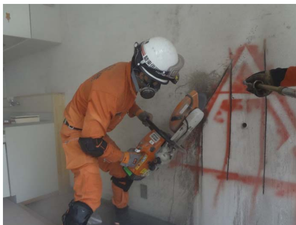
ブリーチング訓練（エンジンカッターを使用し、進入口を設定している様子）