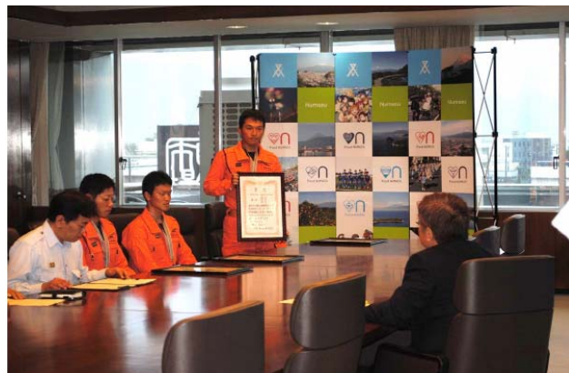
前年度の管理者報告の様子