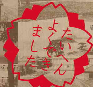
沼津第二尋常小学校