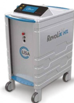
ハイブリッドツリウム ヤグレーザー