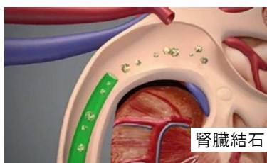
2 破碎したあとの細かい破砕片を吸引で取り出す