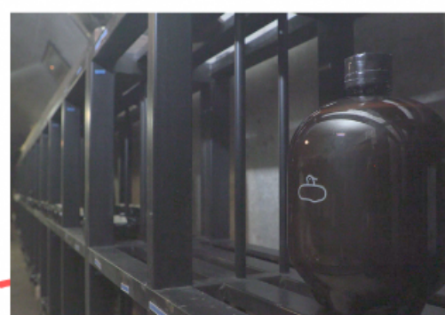
洞穴貯蔵ビール 淡島ホテル ワインセラー

貯蔵クラフトビールと通常クラフトビール、 沼津クラフト、TIELS BREWINGが、 TAP ON SURUGA AWARDで受賞した クラフトビール、計6杯の飲み比べと 淡島ホテル特製の軽食がついた お得な7エス！