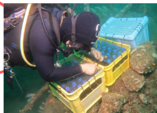
海底貯蔵ビール 淡島周辺の海底