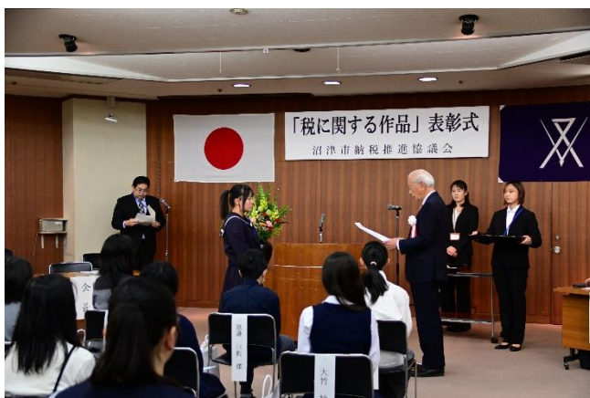
令和6年度表彰式の様子