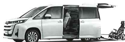
ノアG 車いす仕様車 "タイプ1(車いす1名仕様)"

トヨタユニテッド静岡株式会社 ネットトヨタ静岡株式会社 トヨタモビリティパーツ株式会社 静岡支社 株式会社トヨタレンタリース静岡