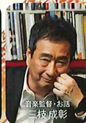
音楽監督・お話 三枝 成彰