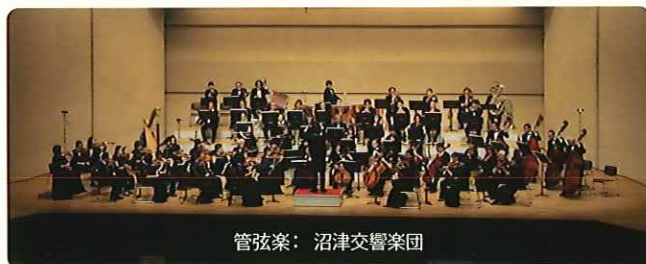
管弦楽：沼津交響楽団