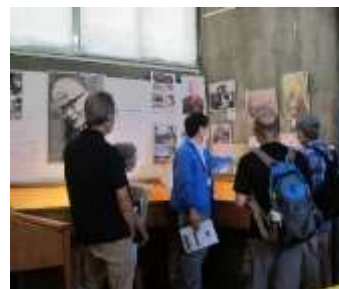
前回（令和6年8月）の様子