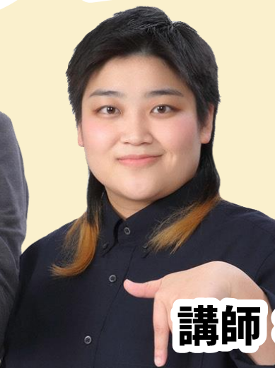
ソイさん (カエルサークル)