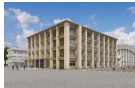
【大岡中学校新校舎完成イメージ図】