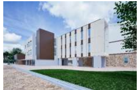
【第四小学校新校舎完成イメージ図】