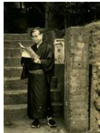
芹沢光治良 昭和23年 世田谷区三宿町の寓居で