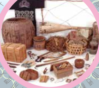
沼津内浦・静浦及び周辺地域の漁撈用具