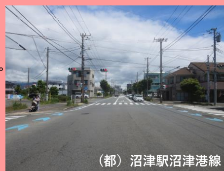
(都) 沼津駅沼津港線