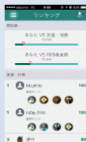
ランキング・ バッジ獲得