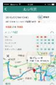
安全運転のヒント