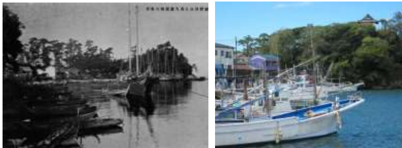
展示資料の一例(沼津市我入道の船溜まり 当時と現在)