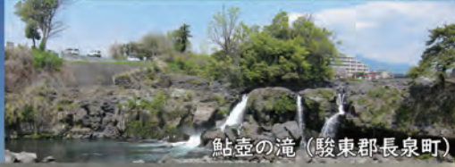
鮎壺の滝 (駿東郡長泉町)