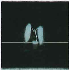
《夢の中の会話》 エッチング、エングレーヴィング 雁皮刷 / 12.0x11.0cm 2013年