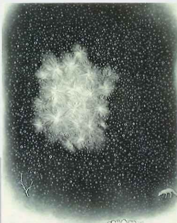
《光のある場所》 エッチング、アクアチント エングレーヴィング、雁皮刷 / 21.5x18.5cm 2017年