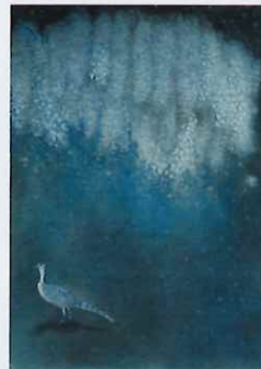
《お気に入りではない場所》 エッチング、アクアチント 雁皮刷 15.0x10.5cm 2012年

結城は日常の記憶の風景、或いはその記憶を画面に配置し夢の世界を構築します。白い光の粒子が広がる詩情溢れる銅版画の世界をぜひご高覧ください。