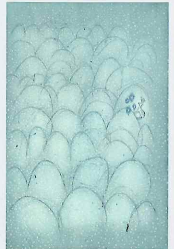
《世界を股に掛ける鹿》 エングレーヴィング、ドライポイント、エッチング 雁皮刷 21.5x14.0cm 2019年