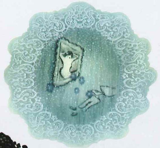
《メトロポリタンミュージアム》 ドライポイント、エッチング、エングレーヴィング 雁皮刷 / 15.5x16.5cm 2020年

結城泰介は1978年東京都に生まれ2003年武蔵野美術大学大学院造形研究科美術専攻版画コース修了、その後ハーグ王立美術アカデミー（オランダ）に留学しました。帰国後2007年第75回記念版画展（日本版画協会）にて19.5x22.5cmという小さなサイズで山口源新人賞を受賞し脚光を浴びます。現在では地元小平市に様々な人が銅版画やリトグラフを制作出来る版画工房 TYP5 を設立。以後代表を務めつつ2021年より父の故郷山形市の美大、東北芸術工科大学で教鞭を執っています。