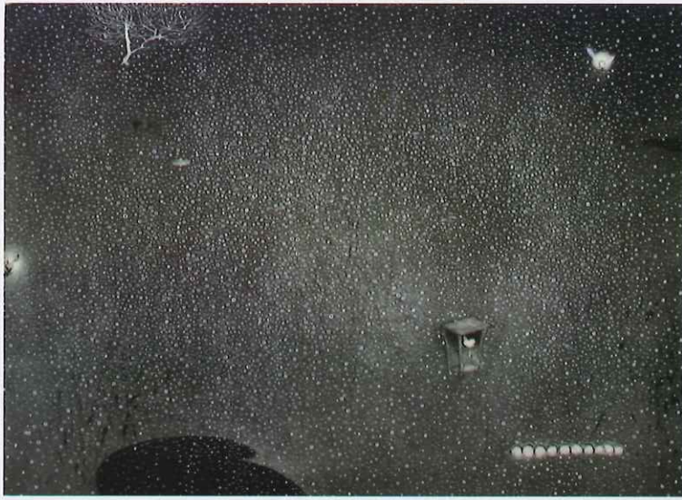
《In my Garden 1》 エッチング、アクアチント ドライポイント、雁皮刷 / 26.5x36.5cm 2010年