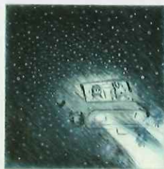
《真夜中のドライブ》 エングレーヴィング、ドライポイント エッチング、雁皮刷 / 12.0x11.0cm 2020年