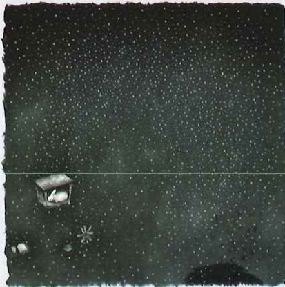
《まどろみの庭》 エッチング、アクアチント、ドライポイント エングレーヴィング、雁皮刷 / 21.0x21.0cm 2013年