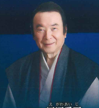
えがわあいじ ゲスト 江和愛司 (歌手)