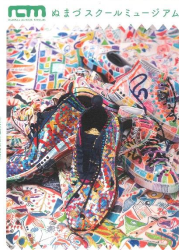
美術館が小学校にやってくる! /

※第四小学校でのスクールミュージアムは、児童・教職員等関係者及び報道機関に限定して開催します。一般向けには、終了後、庄司美術館内にスクールミュージアムの展示を再現した作品展を開催します。【11月25日(土)~12月23日(土) ※月曜日休館】