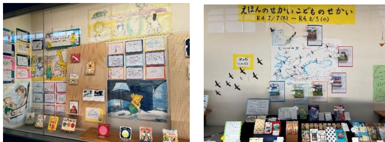
昨年度の展示の様子