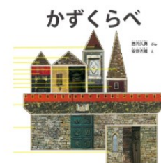
『かずくらべ』福音館書店

● 図書館員 わたしの1冊 春の木ぐるんぱ おすすめの1冊 (幼稚園よみきかせグループ)