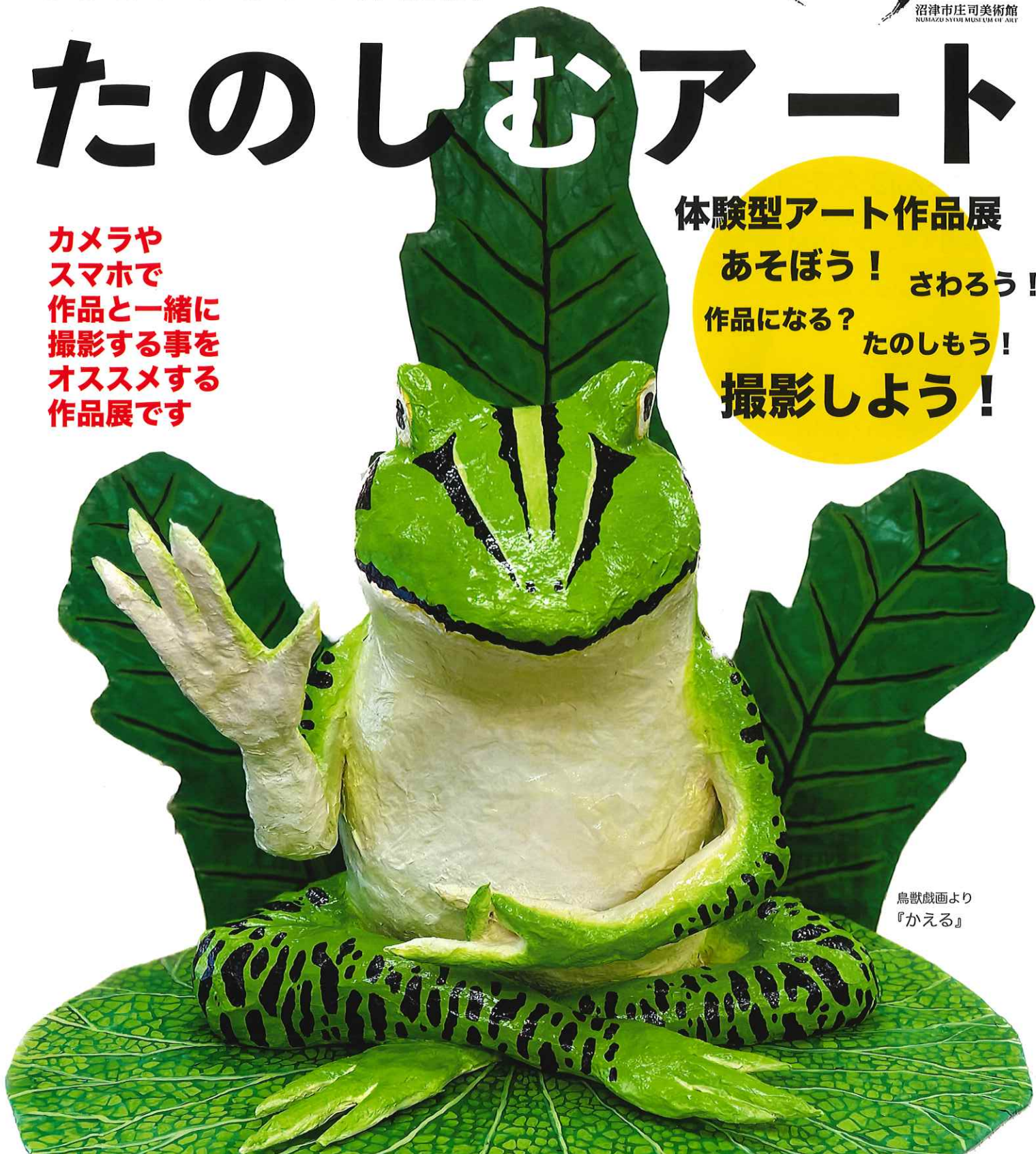
鳥獣戯画より 『かえる』