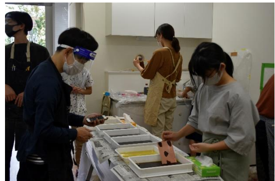
※昨年の公募銅版画ワークショップの様子