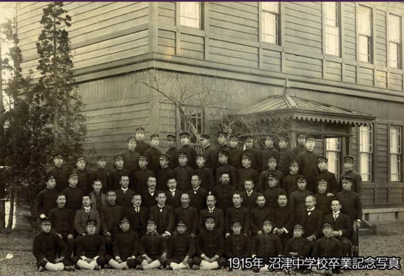
1915年 沼津中学校卒業記念写真