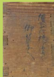
備前守より拝領の御菓子入 (文政7(1824)年) 沼津市明治史料館所蔵