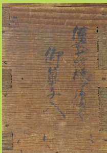
備前守より拝領の御菓子入 (文政7(1824)年) 沼津市明治史料館所蔵