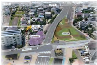
受付番号2 伝承の道～古代と未来をつなぐ～