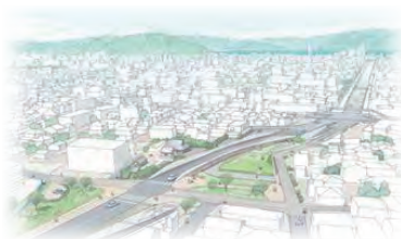
受付番号1 ふるさとの風景をつくる「みちにわ」

「(都)沼津南一色線と高尾山古墳を含む周辺までを一体的な空間として設計し、質の高い整備を行うことで良好な景観の形成を図る」という目的を達成するため、設計競技方式によるデザインコンペを実施しております。このたび、最優秀提案者の決定に向けた、一次評価通過者(4件)による公開プレゼンテーションを開催します。