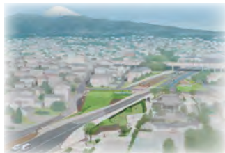
受付番号4 築土構木へ立ち返る