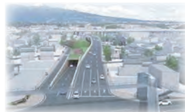
受付番号5 スルガの記憶をまもり文化をつなぐ