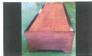
3 ボックスセクション