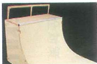
1 バームセクション

比較的難易度の低い障害物（パンプトラック等）を設置し、BMX、MTB、ランバイク、スケートボードなど、幅広い年齢層とジャンルの愛好者が、自転車競技を楽しめる施設内容としています。