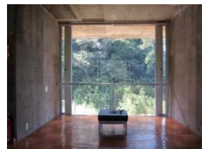
PVを再現した撮影スポット