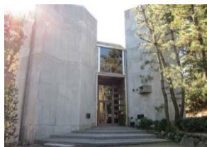
沼津市芹沢光治良記念館外観