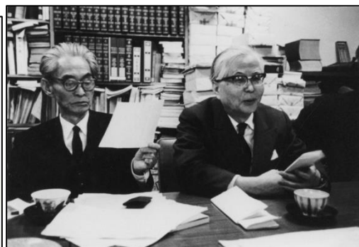
▲川端康成と芹沢光治良