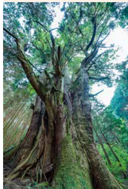
河内の大杉