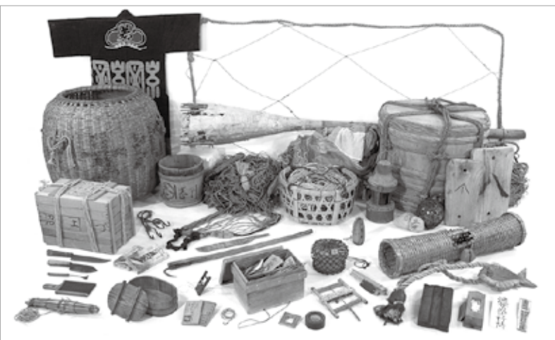
国指定重要有形民俗文化財 沼津内浦・静浦及び周辺地域の漁撈用具