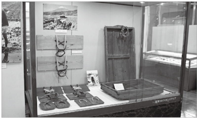
県指定文化財 浮島沼周辺の農耕生産用具