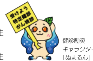
健診勸奨 キャラクター 「ぬまるん」