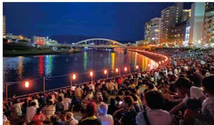
※沼津夏まつり・狩野川花火大会の詳細は、沼津観光ポータルをご覧ください。 https://numazukanko.jp/

てね。川岸に立つと景色もいいし通り抜ける風も気持ちがいい。こんないいところ他にはないんじゃないかな」と笑います。続けて「草刈りや掃除をしてくれている人もいます。昔と比べるとごみも少なくなってきた。たくさんの方が川を守りたいって気持ちを持ち続けてくれると川も喜ぶでしょうね」と教えてくれました。美しい川を後世に残していくため、7月の河川愛護月間を機に、皆さんも身近な川のことをもっとよく知り、もっと愛してみませんか。