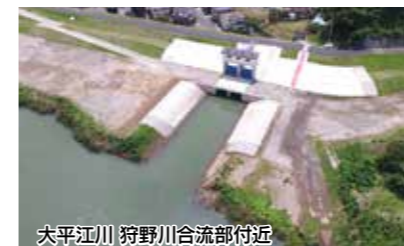
大平江川 狩野川合流部付近

▶ 浸水対策関連事業 【8億1,200万円】 常襲浸水地域の浸水被害を軽減するため、大平江川排水機場及び井戸川雨水貯留池の工事を実施するとともに、西添町に新たな排水ポンプ施設を増設するほか、近年の激甚化する豪雨災害に対応するため、非常時に機動的に運用可能な排水ポンプ車・排水ポンプパッケージを導入します。