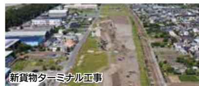
新貨物ターミナル工事

鉄道施設本体工事の第一弾となる新貨物ターミナル工事に続き、新車両基地においても工事に着手するなど施設整備を本格化するほか、静岡東部拠点土地区画整理事業における建物等の移転や、鉄道施設と交差する道路等の整備に取り組みます。