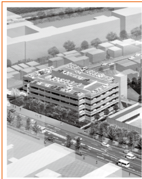
立体駐車場の完成イメージ図

供用時間 24時間(年中無休) ※22時30分～翌日7時までは入出できません。 構造 地上4階建 鉄骨造(屋上階有) 駐車台数 全299台(普通車用283台、軽自動車用15台、身障者用1台) ※障害のある人等が市役所をご利用される場合は、庁舎別館南側のゆずりあい駐車場をご利用下さい。