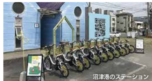
沼津港のステーション