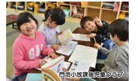
門池小放課後児童クラブ

▶ 放課後児童クラブ運営事業 【3億1,146万円】 金岡小学校にクラブを増設して、待機児童の解消を図るとともに、令和3年4月の長井崎小中一貫学校開校に向けて、放課後児童クラブの整備を進めます。