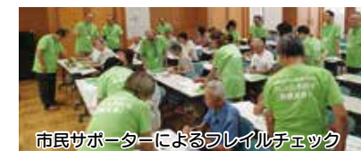
市民サポーターによるフレイルチェック

▶ フレイル対策事業 【191万円】 高齢者が楽しみながら継続的に健康チェックする活動の普及に向けて、その活動の核となる市民サポーターの増員を図るなど、フレイル対策に取り組みます。