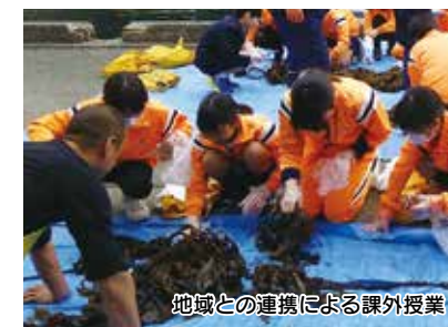
地域との連携による課外授業

▶ 「チーム学校」実現事業 【1,000万円】 「チーム」として学校を支える体制を整えるため、各種支援員や地域人材等の活用を進めるとともに、学校と地域の連携・協働体制の構築に向けて、モデル地区に学校運営協議会を設置します。