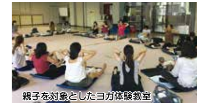
親子を対象としたヨガ体験教室

▶ マミーズほっとステーションぬまづ運営事業 【767万円】 妊娠期から子育て期にわたる切れ目のない支援を実施するとともに、新たに産後ケア事業における多胎児加算に係る自己負担の廃止や、要支援産婦に対する訪問型育児支援の初回利用無料化を実施します。