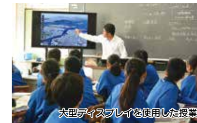
大型ディスプレイを使用した授業

▶ 情報機器整備事業 【1億8,120万円】 情報活用能力の育成を図るため、小学校6年生の全普通教室に大型ディスプレイを導入するとともに、職員用タブレットを導入するなど、情報教育に係る環境を整備します。