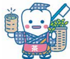
日本歯科医師会 PRキャラクター よ坊さん