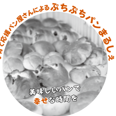
子育て応援パン屋さんによるぶちぶちパンまるしほ

子どもの成長に合わせて着られなくなった服を、必要としている人へメッセージを添えて交換できます