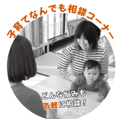
子育てなんでも相談コーナー