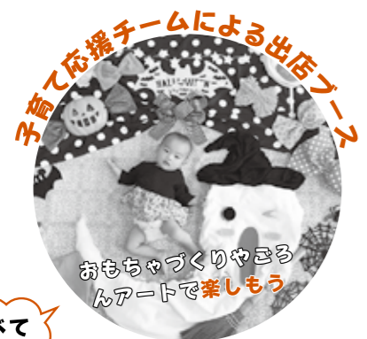
子育て応援チームによる出店ブース

「この日が笑顔の子育ての入口になってくれたら。」そんな想いで有志のみなさんが集まってくれました。沼津で子育てする親子に必要とされているものは何だろう、そのために自分たちに何が出来るのかなど真剣に考えて、カタチにした Proud NUMAZU kosodate フェス。親子に優しい、みんなで楽しめるイベントにぜひお越しください! /