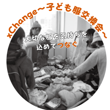
*Change~子ども服交換会~ 大切な服を気持ちを込めてつなぐ

アロマやフェイスペイントなど10ブース以上が出店! 充実した内容で親子みんなを笑顔にします♡