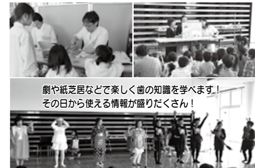
劇や紙芝居などで楽しく歯の知識を学べます！その日から使える情報が盛りだくさん！

と き 6月11日(日)、9時30分～12時(受け付けは11時30分まで) ところ プラサヴェルデ3階・4階 内 容 ①歯科健診、健康相談、歯ブラシ指導、 ひんごう 健口コーナー、8020推進員による寸劇など ②8020達成者の表彰(対象者には事前に通知します) ◎沼津市歯科医師会 ☎055-963-0425