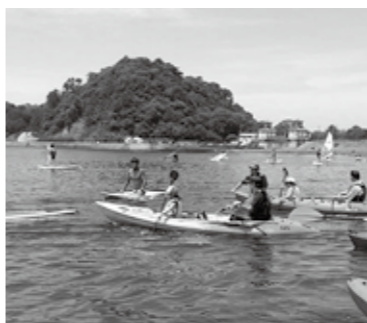
ホームページアドレス http://numazubeachfes.blogspot.jp/

〔間〕沼津千本浜マリノクラフ ☎0555・954・2222 〔間〕水産海浜課(水産海浜係) ☎0555・934・4753 とき 8月28日(日)、9時～16時 ところ 牛臥海岸、牛臥山公園 内容 アクティビティ体験(シーカヤック、ウインドサーフィン他)、「ビーチバレー大会、フード・クラフト・ワークショップ他 ※ビーチバレー大会は、事前申込が必要です。 ※参加料など詳細は、ホームページをご覧ください。