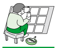
襖・障子の張り替え

◆シルバー人材センターに入会しませんか 沼津市シルバー人材センターには現在約1,300人の会員が登録され、植木の剪定、草刈り、通院の介添え等の臨時的・短期的で簡単な仕事を行っています。危険を伴う仕事や重労働はありません。 入会の条件 ・市内に住む60歳以上で、健康で働く意欲のある人 ・沼津市シルバー人材センターの趣旨に賛同する人 ※詳細は、お問い合わせ下さい。