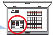
例：分電盤内蔵タイプ